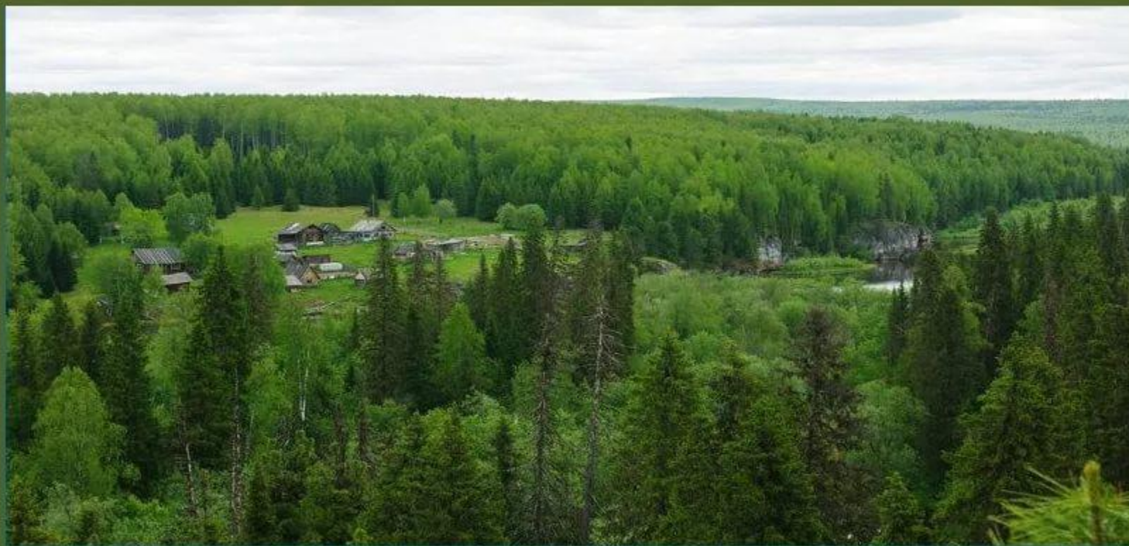
Кордон Шежым на территории Печоро- Илычского заповедника

Один из самых старых природных парков России, он был создан 1930 году. Находится на западных склонах Северного Урала и занимает площадь 721,3 тыс. га. Носит статус биосферного резервата.