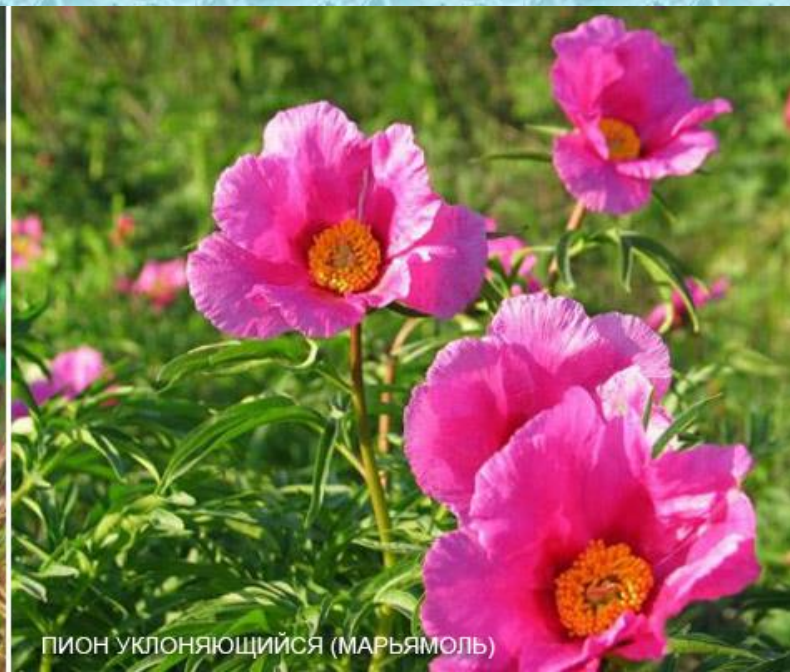
ПИОН УКЛОНЯЮЩИЙСЯ (МАРЬЯМОЛЬ)