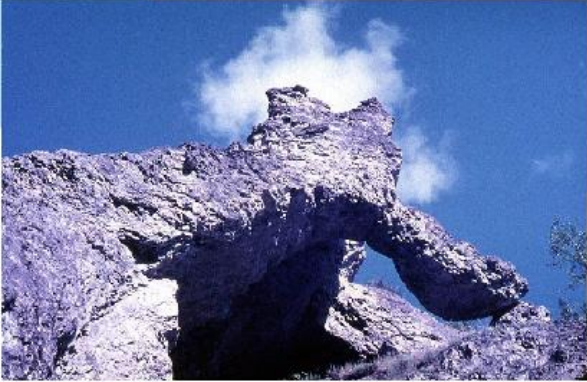
Живописные формы скал